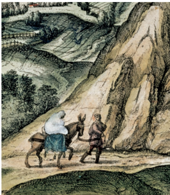
La población morisca tuvo gran importancia en Murcia.

Por su parte, Felipe II se enfrentó en 1568 a la rebelión de los moriscos de Granada, que se sublevaron contra un edicto que reducía su libertad religiosa. La rebelión se extendió por las Alpujarras y llegó hasta los moriscos murcianos. Juan de Austria en Granada y el marqués de Vélez en Murcia sofocaron la rebelión y, para prevenir posibles rebrotes, repartieron a los moriscos por toda la Península.